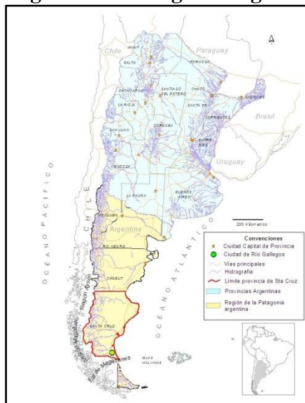
Figura No. 1 Región de la Patagonia argentina y provincia de Santa Cruz